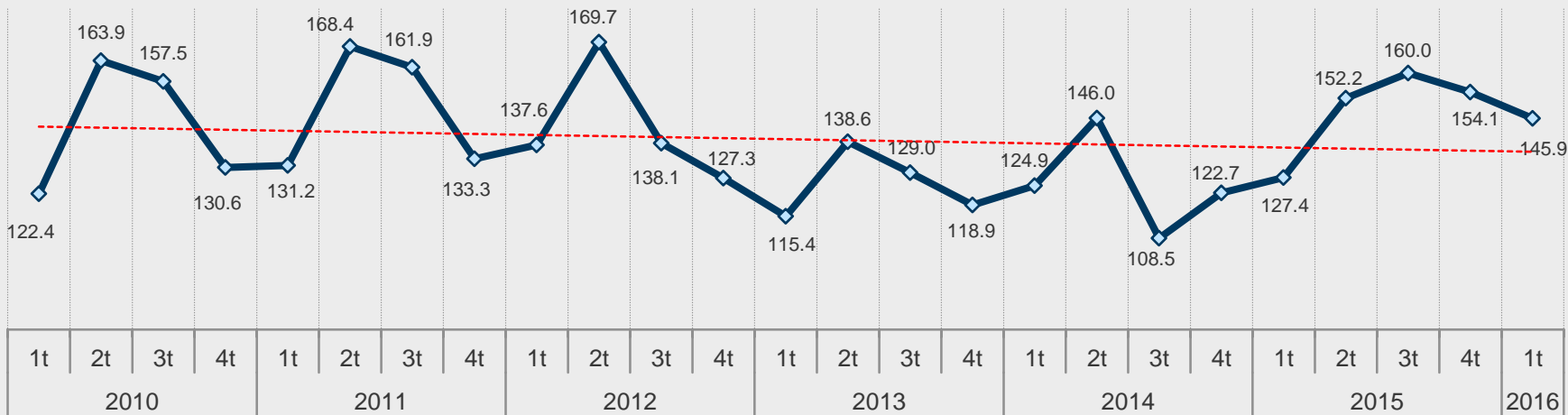
Chiapas Ingresos Trimestrales por Remesas Familiares 1er. Trim. 2010 a 1er. Trim. 2016 (Millones de Dólares)